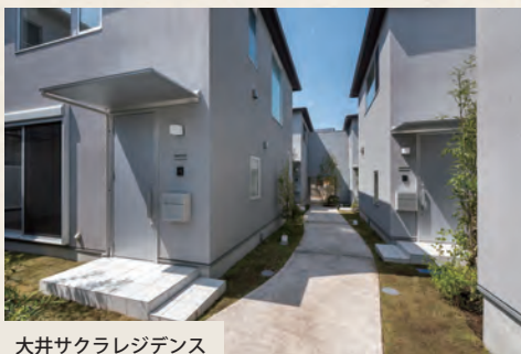
大井サクラレジデンス