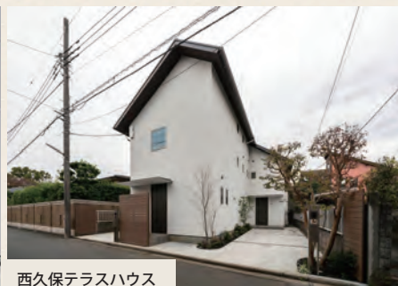
西久保テラスハウス