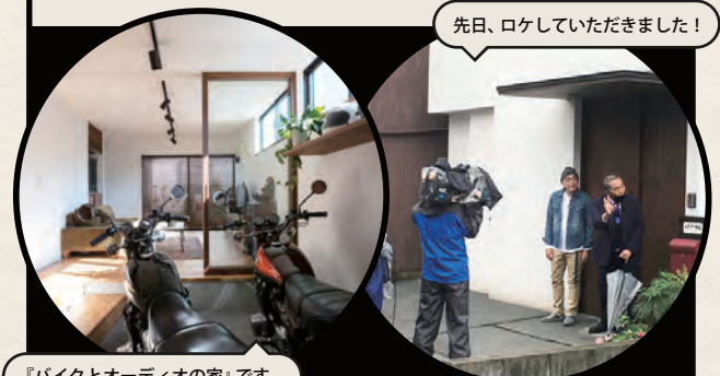
『バイクとオーディオの家』です。