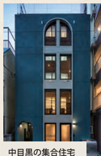
中目黒の集合住宅