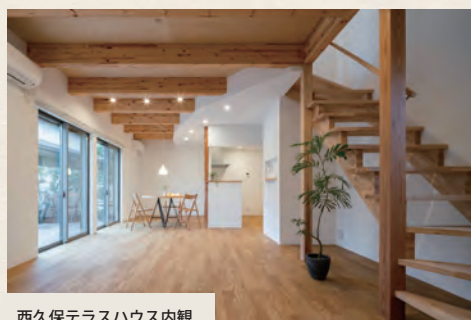
西久保テラスハウス内観

私たちは、暮らしやすさや使い勝手にこだわりながら、その場所の条件を捉え、お施主様にとっての最適解をご提案したいと考えています。戸建住宅から集合住宅、店舗や事務所、その他多用途の施設など規模の大小を問わず、数多くの物件を手がけております。また、有効な土地利用の方法や将来へ向けての事業計画についてのご相談も承ります。