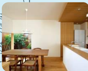
2013年竣工 緑町の家 建築家自邸

建築家が自ら設計した自邸 自分のための住まいと向き合って 気づいた事・感じた事をお話します!!