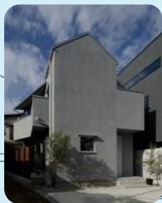
2017年竣工 井の頭の家Nさん

建主OBをお招きし 実際に住んでみて 感じた事を盛り込んだ 座談会を開催します。